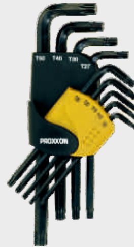
Sada zástrčných kľúčov TORX; 9-dielna