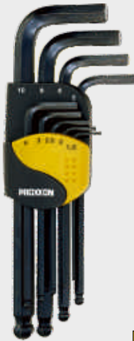
Sada zástrčných kľúčov 6-hran; 9-dielna