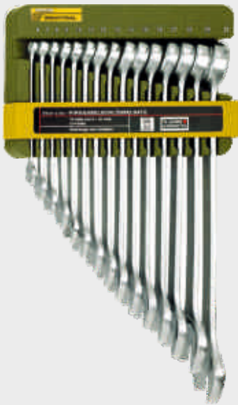
Sada očkochých kľúčov 15-dielna