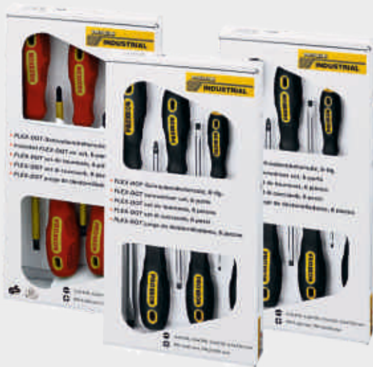
FLEX – DOT Sady skrutkovačov – 6 dielne.

Súpravy, ktoré nesmú chýbať vo výbave žiadneho mechanika. Kompletne vybavenie.