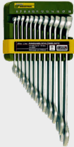
Sada očkochých kľúčov 12-dielna