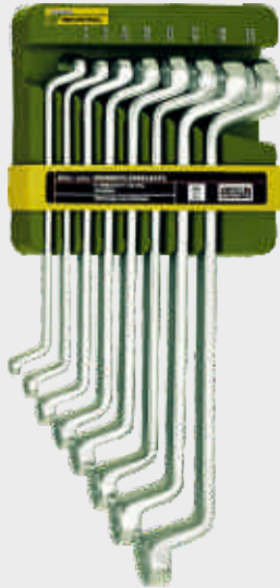
Sada očkových obojstranných kľúčov 8-dielna