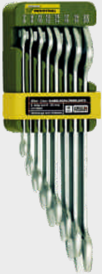
Sada vidlicových obojstranných kľúčov 8-dielna